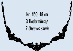
Nr. N50, 48 cm 3 Fledermäuse/ 3 Chauves-souris