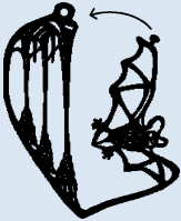
Nr. 2376, Fledermaus in Höhle, 3-D/ Chauve-souris dans grotte, 3-D