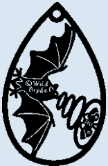
Nr. 0441, Fledermaus+Motte, Chauve-souris+mite