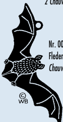
Nr. 0008, Fledermaus/ Chauve-souris