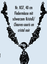
Nr. N37, 40 cm Fledermäuse mit schwarzem Kristall/ Chauves-souris en cristal noir