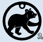
Nr. 1579, Babybär/Petit ours