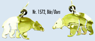
Nr. 1572, Bär/Ours