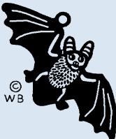
Nr. 1866, Baby Fledermaus/ Petite chauve-souris