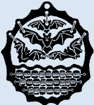
Nr. 1341, Fledermäuse in Höhle +Perlen/ Chauves-souris dans une grotte+perles