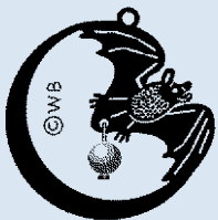
Nr. 1338, Mondsichel mit Fledermaus/ Chauve-souris en croissant de lune