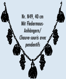
Nr. N49, 40 cm Mit Fledermaus-Anhängern/ Chauve-souris avec pendentifs